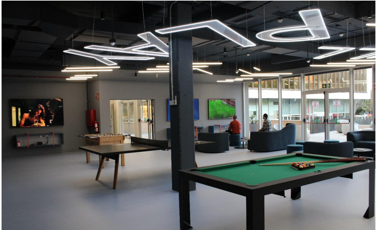
Social Area de las oficinas centrales de Nestlé en Esplugues de Llobregat (Barcelona)

Tras la pandemia, la combinación del trabajo presencial con el teletrabajo es uno de los grandes retos a los que se enfrentan las empresas. Los nuevos formatos híbridos en los que conviven reuniones presenciales con las online o incluso mixtas, hacen que las jornadas presenciales sean clave para reforzar y enriquecer las relaciones entre la plantilla.